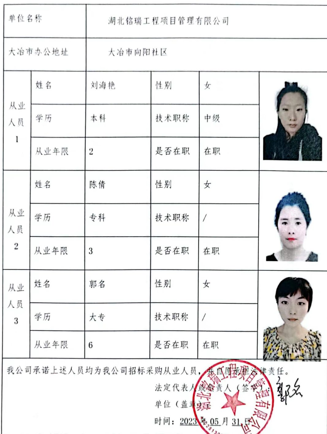
附件 3： 招标（采购）代理机构从业人员情况记录表