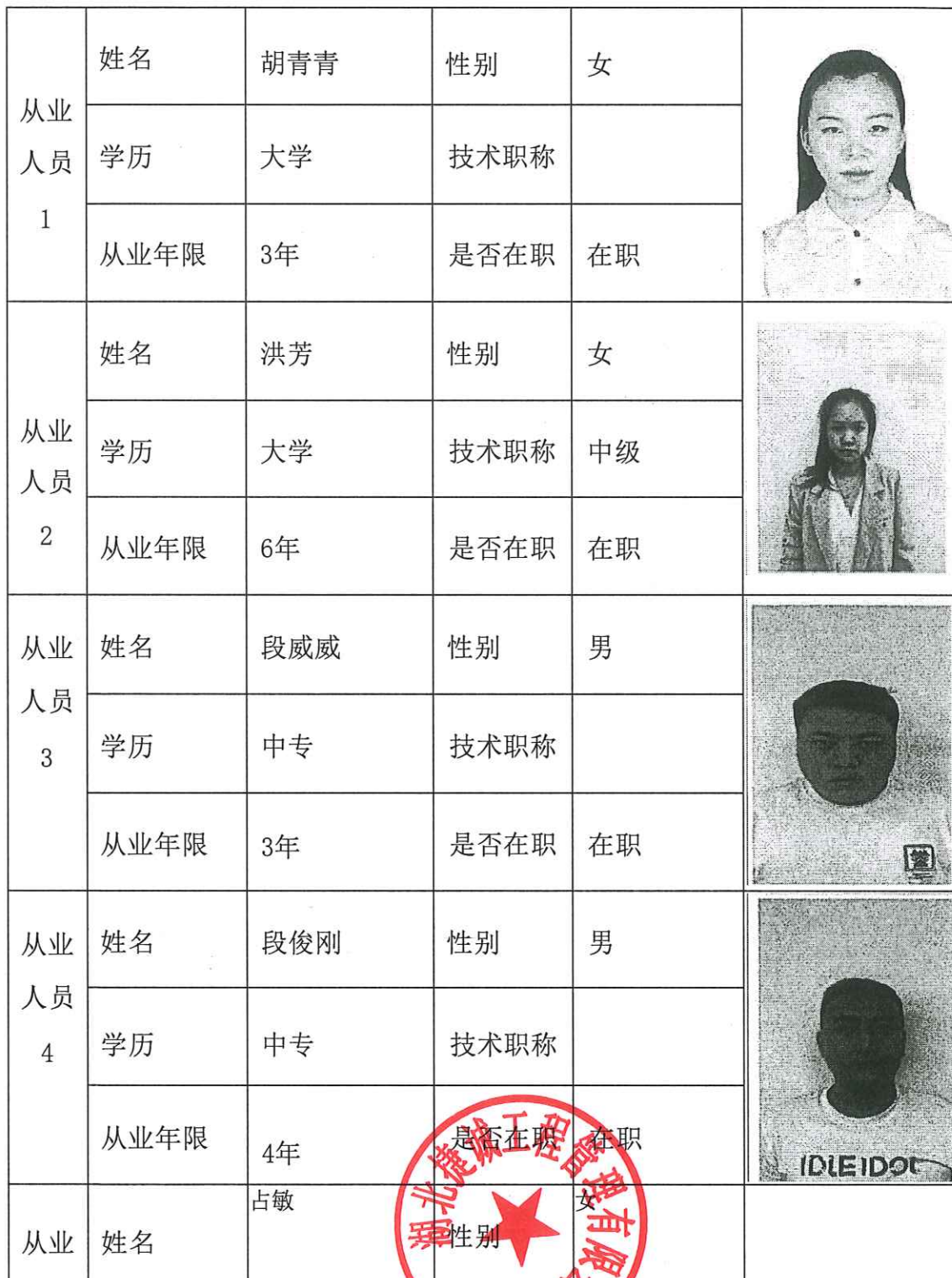
招标(采购)代理机构在黄石地区从业情况记录表