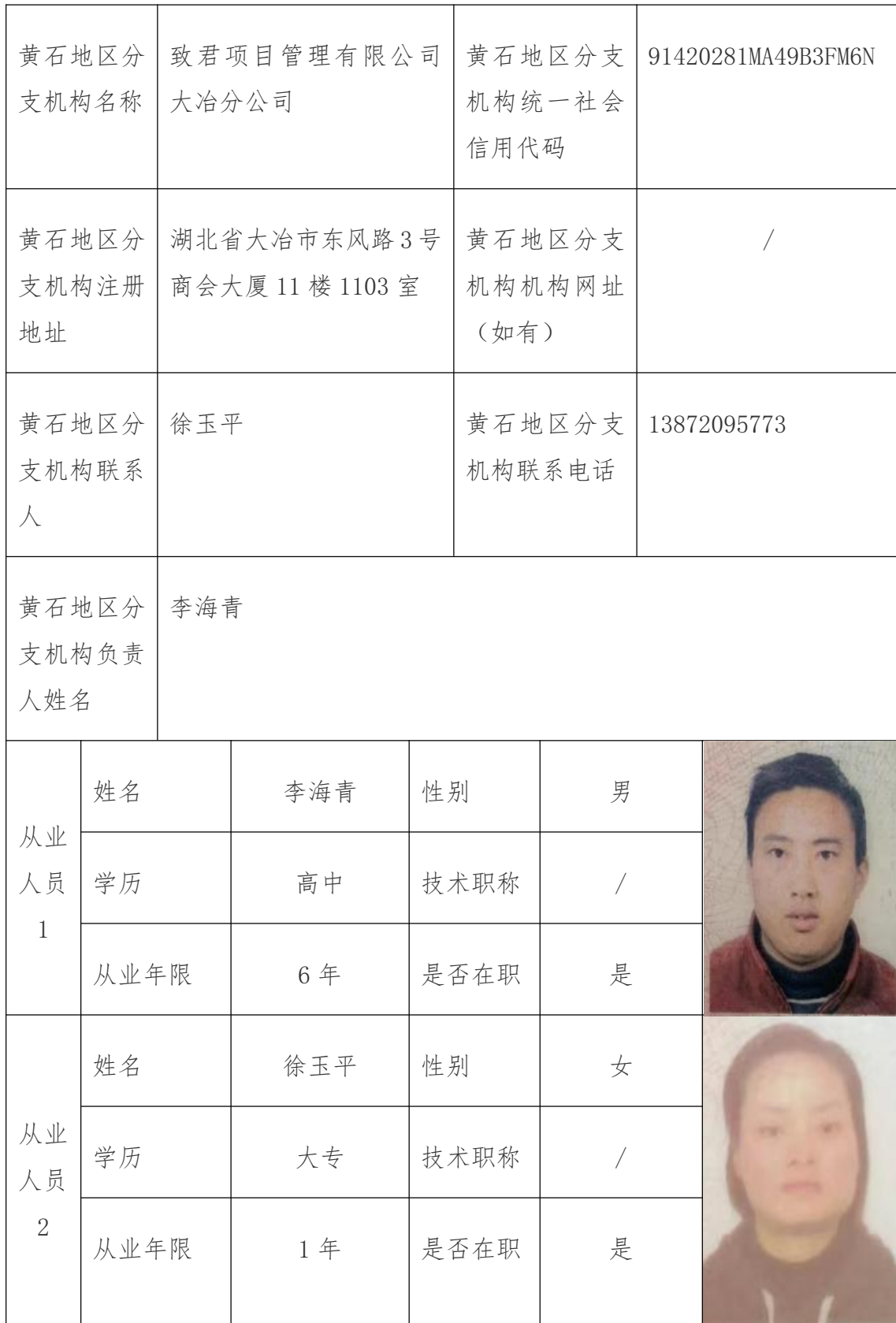
招标（采购）代理机构在黄石地区从业情况记录表