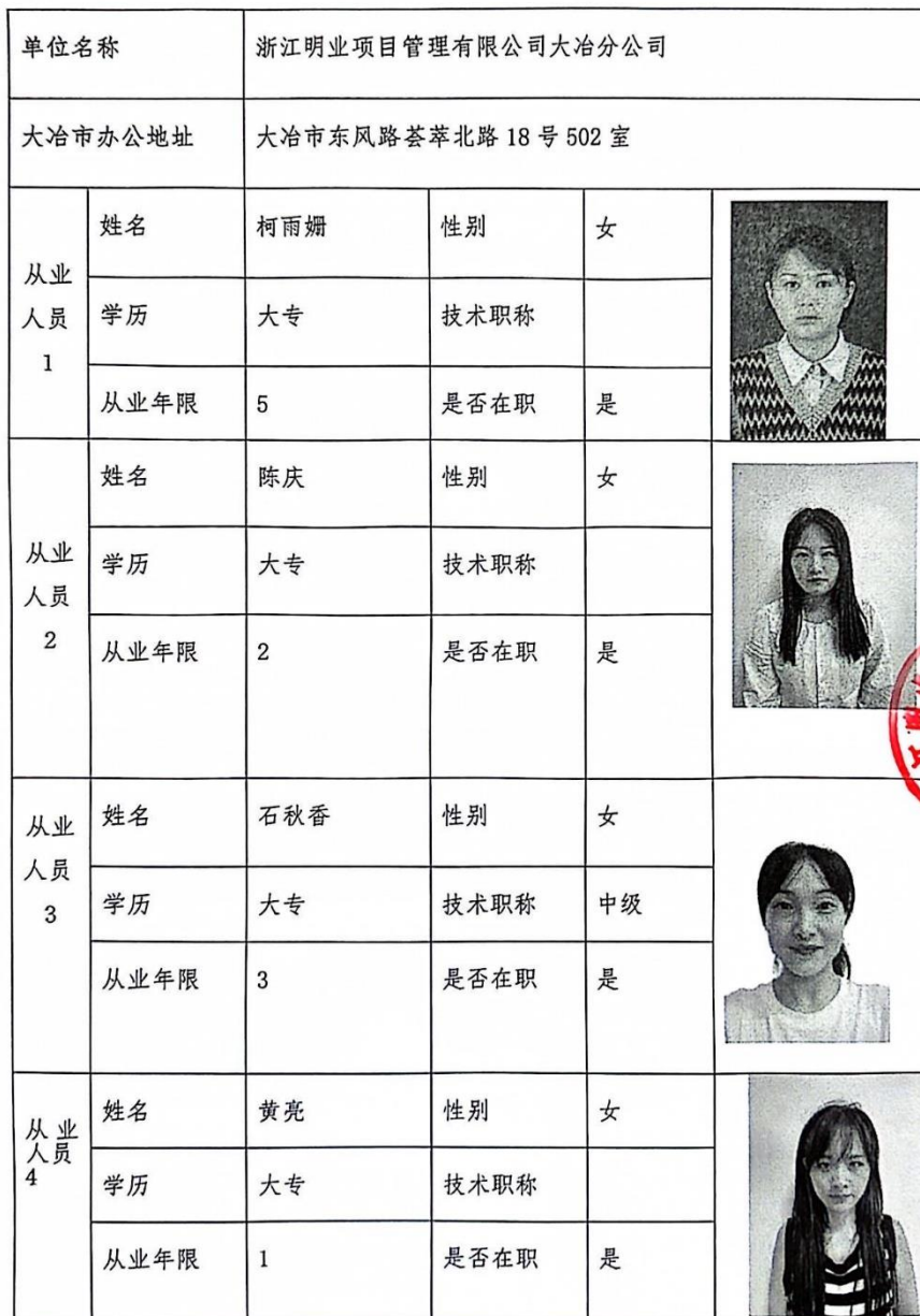
附件 3： 招标（采购）代理机构从业人员情况记录表