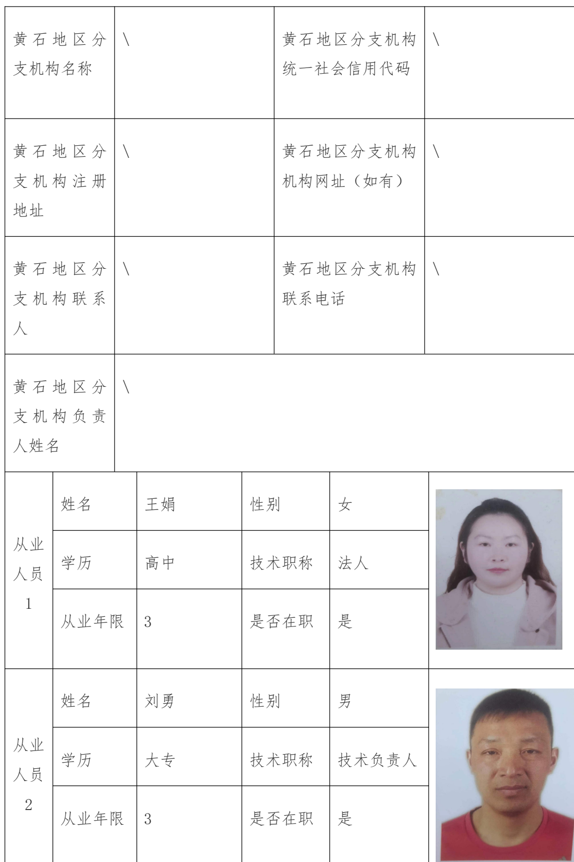
招标（采购）代理机构在黄石地区从业情况记录表